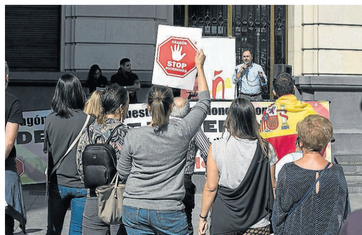
Participantes en la protesta, ayer.

Stop Sucesiones volvió a concentrarse, ayer, en la plaza de España, para trasladar su indignación por la decisión del Ejecutivo de Pedro Sánchez de armonizar el impuesto de Sucesiones. El colectivo denunció que podría conllevar una mayor presión fiscal y criticó la reforma aprobada en las Cortes de Aragón, que entrará el vigor el 1 de noviembre, porque es «insuficiente» y «electoralista».