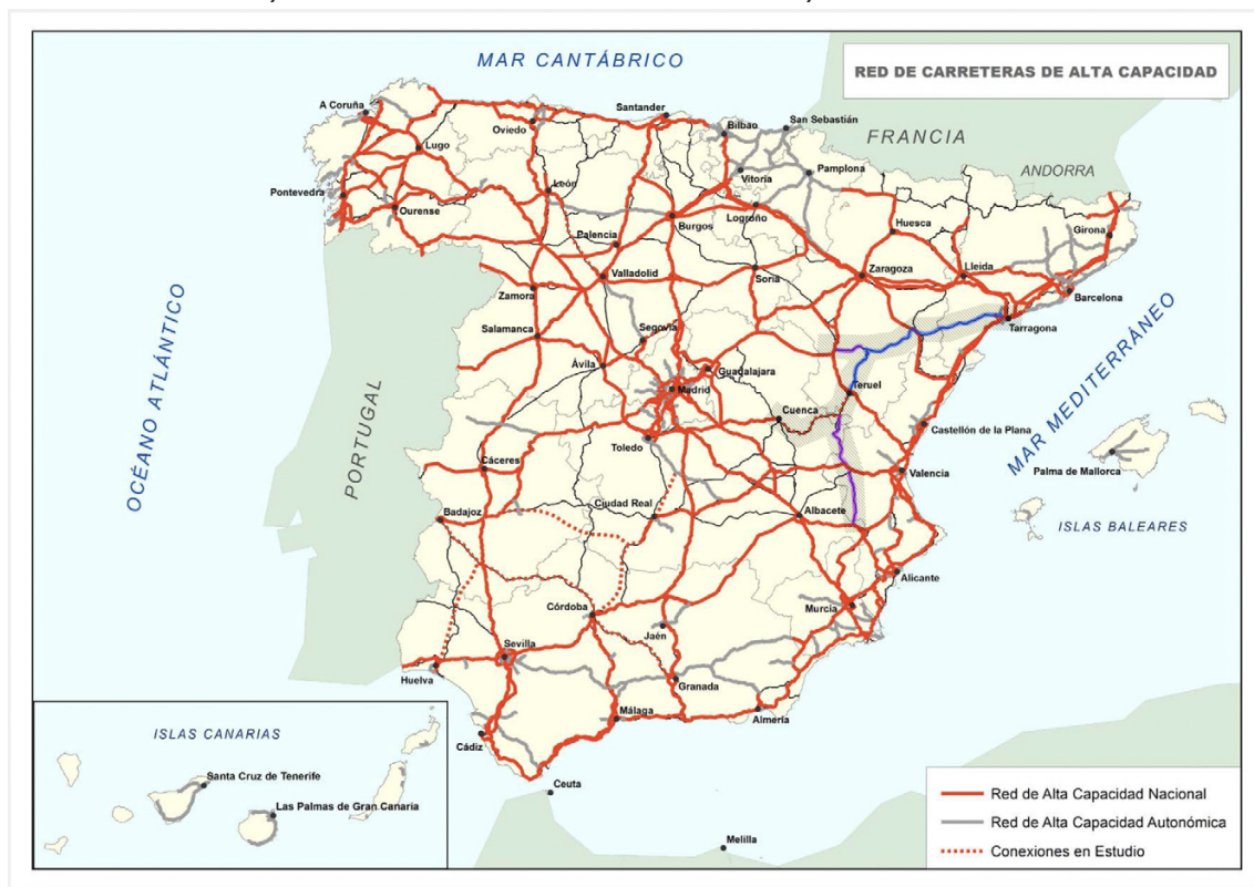
Figura 3. Red de carreteras de alta capacidad con la inclusión del «Arco Mediterráneo Interior», cuyos tramos de autovía nueva van en azul y morado

Un fragmento del territorio nacional muy amplio, muy extenso, que es necesario vertebrar con el trazado de los ejes previstos en los planes estratégicos de infraestructuras pero no ejecutados. Mediante la ejecución del plan propuesto, la red radial de autovías en la actualidad quedaría mallada por un eje norte sur, el Arco Mediterráneo interior, como se recoge en la figura 3.