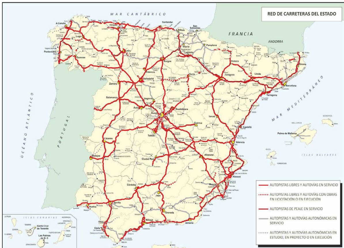
Figura 1. Plano actual de autovías y autopistas

Esta proposición no de ley se centra en la necesidad de completar la vertebración del centro con el este peninsu-lar y el litoral mediterráneo, para avanzar en cohesión territorial en una extensa zona peninsular como es el sector meridional del Sistema Ibérico. Como evidencia la figura 1, la actual organización de autovías y autopistas deja un extenso vacío en forma de rombo, entre Madrid, Zaragoza, Barcelona y Valencia, fuera de la accesibilidad propor-cionada por estas infraestructuras (con la excepción de las zonas cercanas a la A-23).