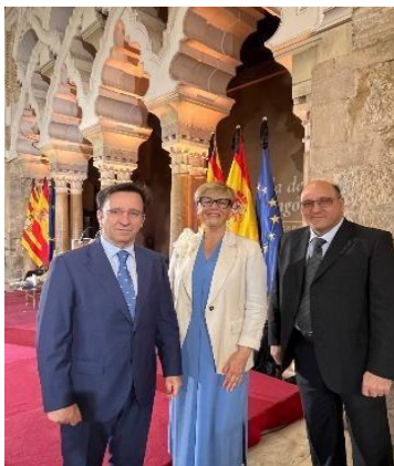
El Consejo de la Cámara, en el Palacio de la Aljafería, durante la celebración del Día de Aragón 2025

La relación entre la Cámara de Cuentas y las Cortes de Aragón va más allá de su función estrictamente fiscalizadora y se proyecta también en el ámbito institucional y protocolario. Esta conexión se manifiesta en la participación del presidente y los consejeros de la Cámara en actos oficiales organizados por el Parlamento autonómico, como la celebración del Día de Aragón cada 23 de abril o la asistencia a eventos formativos o culturales de especial relevancia celebrados en el Palacio de la Aljafería. Asimismo, destaca la conmemoración del primer Día de la Cámara de Cuentas en el Patio de los Naranjos de dicho palacio, lo que refuerza su presencia y su papel activo dentro del panorama institucional de la Comunidad Autónoma.