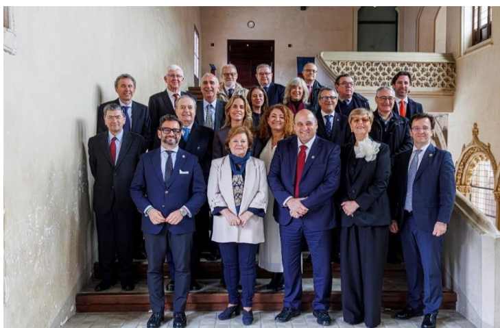
El Consejo de la Cámara de Cuentas de Aragón, junto con los presidentas y presidentas ICEX que acudieron al acto