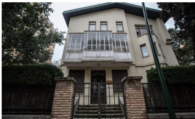
Imagen actual del edificio Lagasca 7, antiguos Juzgados de Menores de Zaragoza

La Cámara de Cuentas será la encargada de rehabilitar, gestionar, conservar y mantener el edificio que convertirá en su sede definitiva.