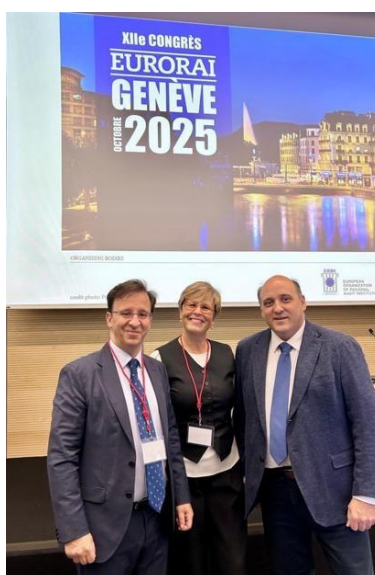
El Consejo de la Cámara de Cuentas en el congreso de EURORAI de Ginebra. Octubre 2025