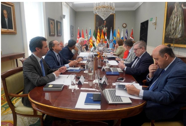
Representantes de los ICEX en Madrid con motivo de la Conferencia de Presidentes de julio de 2025

En el marco de ASOCEX, la Cámara de Cuentas de Aragón participó en la edición de cinco números del Boletín OCEX, que tiene como objetivo dar a conocer la actividad de estas instituciones, así como en los números 85 y 86 de la revista Auditoría Pública, editada conjuntamente.