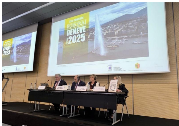
En el centro de la imagen, el presidente y la vicepresidenta, durante su intervención en XIII Congreso de EURORAI, en Ginebra. Octubre 2025.

La presencia del Consejo en este foro internacional forma parte del compromiso de la Cámara de Cuentas de Aragón con la rendición de cuentas, la cooperación institucional y la mejora continua de los sistemas de fiscalización pública, especialmente en ámbitos críticos como la atención a emergencias y la gestión de crisis.