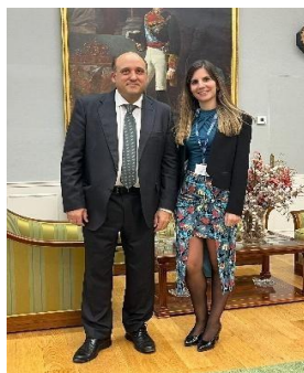
El presidente, Jesús Royo, y la auditora, Esther Nogueras, en el Tribunal de Cuentas durante la celebración del II Encuentro de Jóvenes Profesionales del Control Externo

Además de ello, la Cámara de Cuentas de Aragón colabora estrechamente con el Tribunal de Cuentas y los OCEX a través de comisiones específicas que abarcan desde el ámbito autonómico y local hasta la modernización administrativa. Esta cooperación se refleja en su participación en encuentros técnicos de referencia, como los XVI Encuentros Técnicos de los OCEX celebrados en Córdoba en noviembre de 2025, donde se compartieron experiencias y buenas prácticas en fiscalización pública.