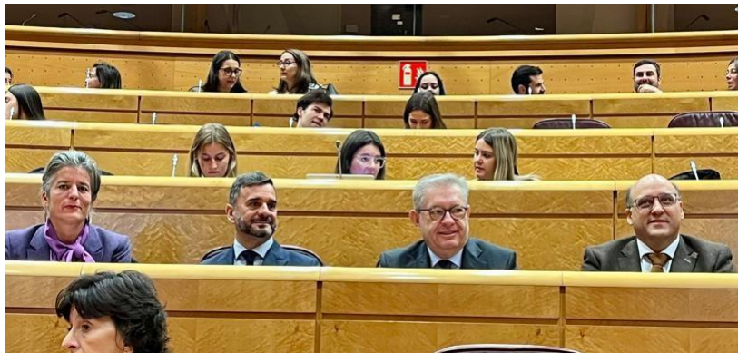
El presidente, Jesús Royo, junto a otros representantes de los OCEX en el Senado durante la presentación del Informe Anual del Tribunal de Cuentas Europeo. Noviembre 2025.

En lo que respecta al Tribunal de Cuentas Europeo, el presidente de la Cámara acudió en diciembre a la presentación en el Senado del Informe Anual correspondiente al ejercicio 2024, destacando así la relevancia que la Cámara concede al control externo europeo.