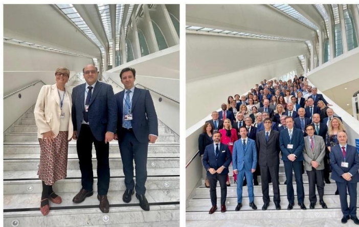
A la izquierda, el Consejo de la Cámara durante la celebración de EURORAI en Oviedo. A la derecha, el Consejo aragonés junto a otros OCEX asistentes al seminario. Abril 2025

La presencia del Consejo en este foro internacional forma parte del compromiso de la Cámara de Cuentas de Aragón con la rendición de cuentas, la cooperación institucional y la mejora continua de los sistemas de fiscalización pública, especialmente en ámbitos críticos como la atención a emergencias y la gestión de crisis.