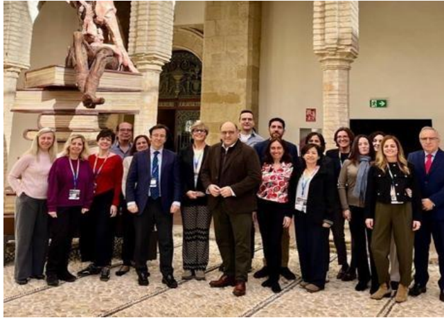
Parte del equipo de la Cámara de Cuentas de Aragón durante la celebración de los XVI Encuentros Técnicos de los OCEX. Córdoba. Noviembre 2025