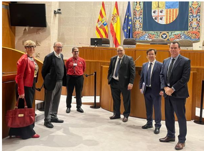
El Consejo de la Cámara de Cuentas junto con los visitantes brasileños durante su visita a las Cortes de Aragón

La visita permitió un fructífero intercambio de experiencias sobre los modelos de auditoría y fiscalización del sector público en España y Brasil. Además, durante la jornada, la delegación brasileña tuvo la ocasión de visitar el Palacio de la Aljafería, y asistir a la comparecencia, ante la Ponencia de Relaciones con la Cámara de Cuentas de Aragón con las Cortes de Aragón, de la presentación de uno de los informes de fiscalización de la Cámara.