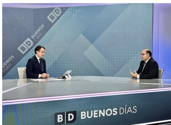
Entrevista del periodista Manuel Gómez al presidente Jesús Royo, en el programa "Buenos días, Aragón", de Aragón TV

La institución también colabora con la divulgación de ASOCEX, en la actualización de diferentes canales de comunicación: el boletín de noticias OCEX, con periodicidad bimensual, las cuentas de Twitter y LinkedIn y la revista Auditoría Pública, que ofrece artículos, información y entrevistas sobre auditoría y control de la gestión pública, contabilidad, legalidad y, en general, sobre todos los aspectos que inciden en la gestión pública y su control. En 2025, se editaron cinco boletines OCEX, así como los dos números de la revista, accesibles en todo su contenido en la página web de Asocex: www.asocex.es