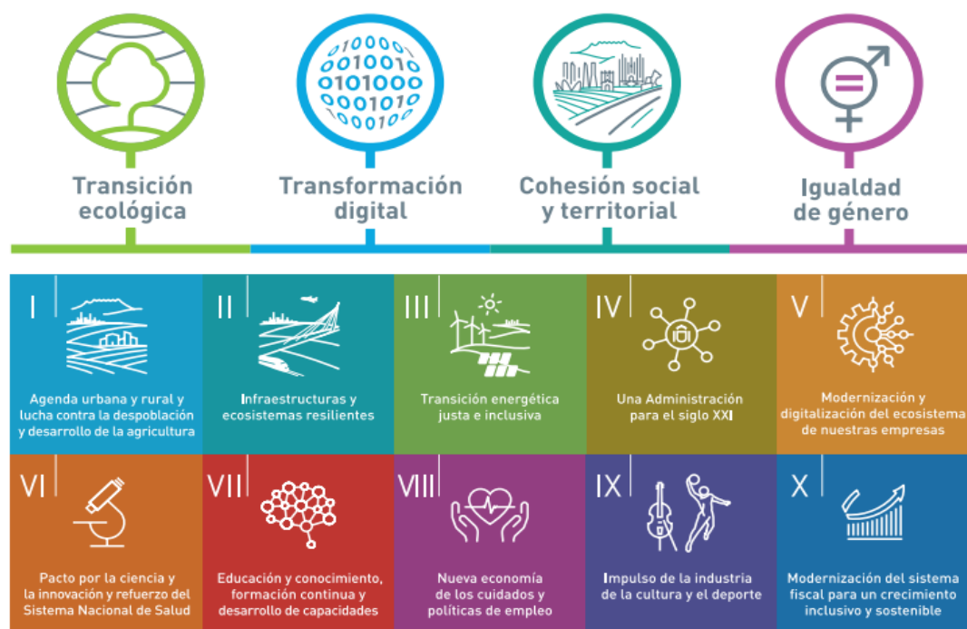
Cuadro 2: Objetivos transversales y políticas palanca del PRTR