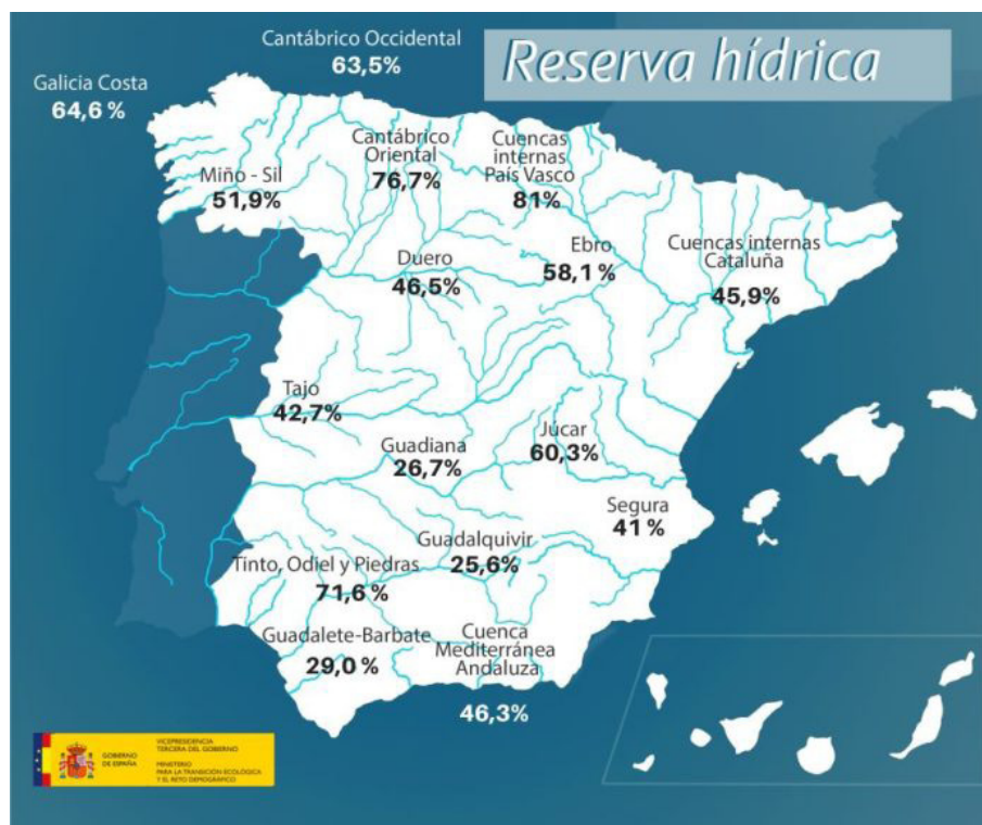
Ilustración 1. Reserva hídrica (Agropopular, 26 de julio 2022). Disponible en: https://www.agropopular.com/reserva-hidraulica-260722/

La prolongada ausencia de lluvias y las altas temperaturas de la temporada estival están causando una grave situación de sequía en la mayor parte de España con varios territorios en alerta roja por escasez. Por ejemplo, la reserva hídrica de las cuencas del Guadiana, el Guadalquivir y Guadalete-Barbate se encuentra a menos del 26,7%, 25,6% y 29%, respectivamente; y las del Tajo y el Segura apenas superan el 40% [Agropopular (2022). «Reserva hidráulica: la cuenca del Guadalquivir se sitúa al 25,6%». 26 de julio. Disponible en: https://www.agropopular.com/reserva-hidraulica-260722/ ]. Además, los pronósticos son peores para los próximos meses [Onda Cero (2022). «Así afecta la sequía histórica en España: las comunidades autónomas que ya aplican restricciones». 27 de julio. Disponible en: https://www.ondacero.es/noticias/sociedad/asi-afecta-sequia-historica-espana-comunidades-autonomas-que-aplican-restricciones_2022072762e11e76b4b11000014264b4.html ].