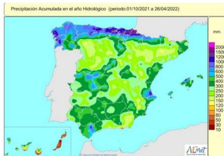
Ilustración 3. Precipitación acumulada en el año hidrológico. (Aemet, 2022)

Esta diferencia en la disponibilidad de agua se aprecia en las reservas hídricas estivales entre la vertiente atlántica y la vertiente mediterránea. Ello exige, por tanto, que se establezcan medidas para distribuir el agua entre todas las cuencas, de forma que a ningún español, independientemente de donde viva, le falte el agua.